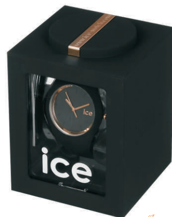
kolor pudełka uzależniony od wyboru modelu zegarka

Producent modeli Ice watch dba o unikalność. MODELE W KOLEKCJI DO WYCZERPANIA OFERTY.