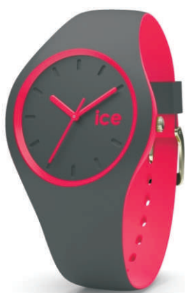
duo-White Sage Small